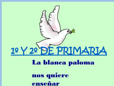
1º Y 2º DE PRIMARIA