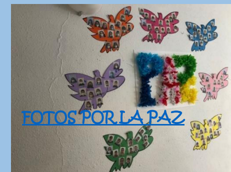
FOTOS POR LA PAZ

PINCHA EN CADA ENLACE PARA VER LOS VÍDEOS