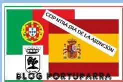
6º DE PRIMARIA