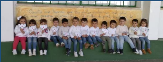
INFANTIL 3 AÑOS