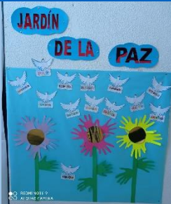
3º Y 4º DE PRIMARIA