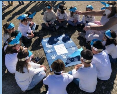
INFANTIL 4 Y 5 AÑOS