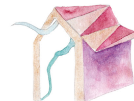
Ilustración del cartel: Deli Cornejo