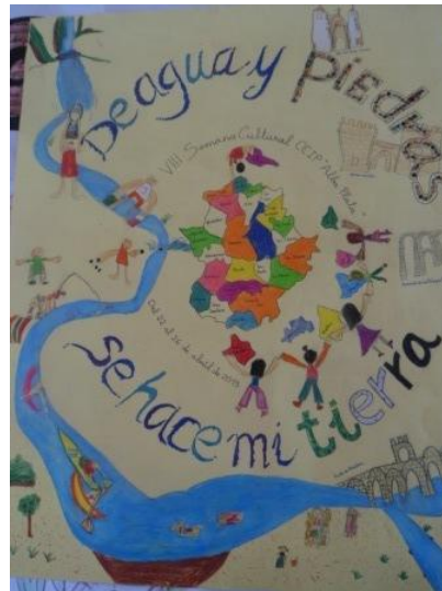
3 er premio concurso de carteles Familia Palomino Durán